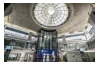
PUERTA TOLEDO (MADRID CAMP)